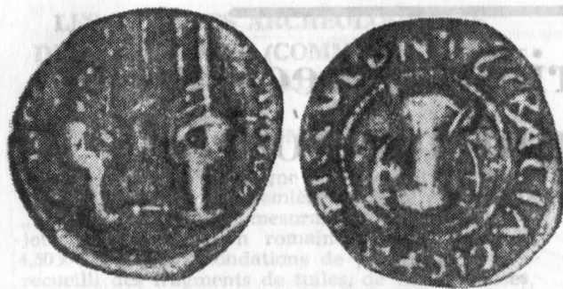
Fig. 1. Păcuiul lui Soare. Monedă de bronz atribuită lui Andronic II și Mihail IX.

de care dispunem putem afirma că aceste locuințe, în număr de 3, ocupînd partea centrală a secțiunilor mai sus citate, au dăinuit în tot cursul celei de-a doua jumătăți a veacului al XIV-lea și în prima jumătate a veacului următor. Ele par a-și datora sfîrșitul, unui incendiu ale cărui urme, zăcînd la suprafață, nu s-au păstrat în întregime fiind risipite în decursul timpului de rădăcinile de copaci. În treacăt vom reaminti că cetatea din insula Păcuiul lui Soare este acoperită de